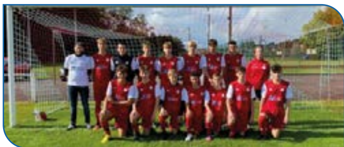
Bravo à l'équipe Fanion qui a été Championne d'Automne, en 2022 !

2022 - Les membres du football-club se joignent à moi pour vous remercier de vos dons lors de notre passage pour les cartes de membres.