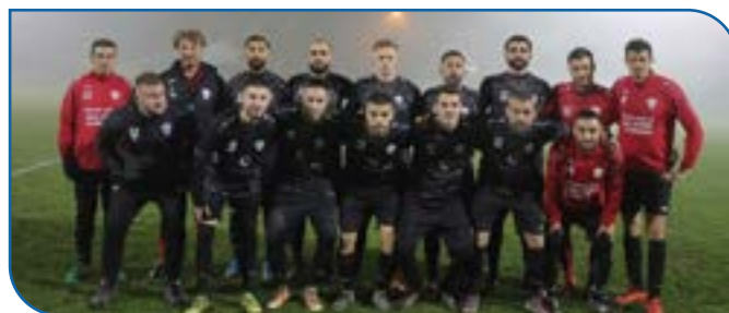
Bravo à notre équipe sénior qui a fini, en 2022, 1er groupe district 3 montée en district 2 !